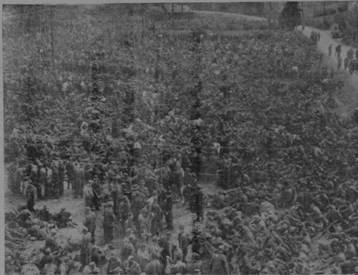
La foto muestra sólo una parte de los 317,000 alemanes apresados por el primero y noveno ejércitos de los Estados Unidos al copar la región del Ruhr, donde la táctica de General Eisenhower asedió a Alemania una de sus mayores derrotas militares de guerra al ejecutarse brillantemente la maniobra de un inmenso cerco doble.