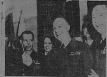
Haciendo el signo de la "V" de la victoria, el General Dwight D. Eisenhower distribuye las plumas que se usaron para firmar el documento de rendición incondicional de los nazis en el cuartel general aliado, en Reims. De izquierda a derecha: el Gral. Walter Bedell Smith, jefe de estado mayor del Gral. Eisenhower, éste, y el Mariscal Sir Arthur Tedder, subcomandante en jefe de los aliados. Foto transmitida a Washington por radio desde Francia.